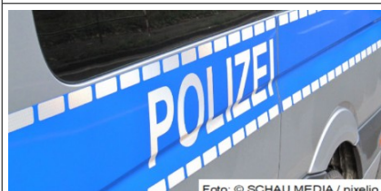
Mehrere Versammlungslagen im Bereich Kaiserstraße