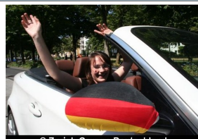
EM 2024: Autokorso und Fan-Kolonnen – die wichtigsten Tipps für feiernde Fans