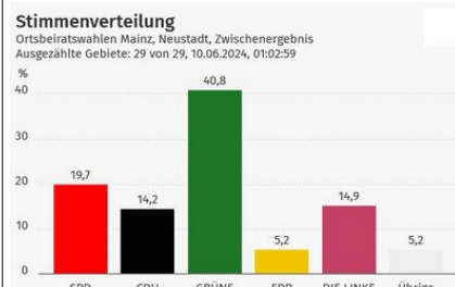
So hat die Neustadt bei der Ortsbeiratswahl abgestimmt