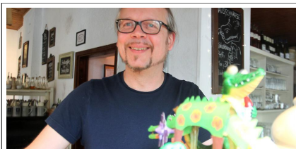
Kultig: Das „Krokodil“ in der Mainzer Neustadt (AZplus)