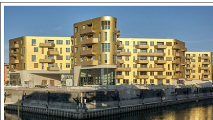
So wohnt Mainz: Zu Besuch im Goldenen Haus am Zollhafen