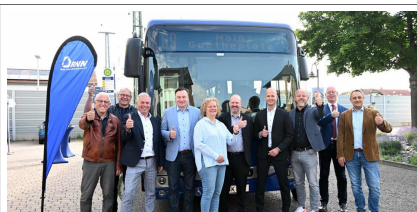
Die Linie 69 fährt bis in die Mainzer Neustadt (AZplus)