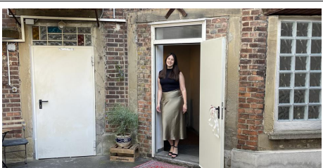
Mainzerin versorgt in der Kaiserstraße 9 große Frauenfüße mit italienischem Chic (AZplus)