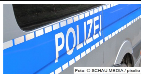
Spayer auf Werksgelände in der Hattenbergstraße