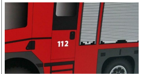
Balkonbrand in der Neustadt drohte auf Mehrparteienhaus überzugreifen