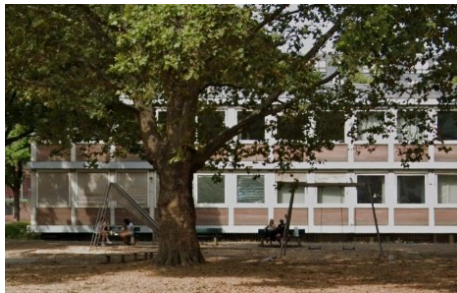
Die Verwaltung des Gutenberg-Museums zieht zum Kurfürstlichen Schloss - Eingeschränkte Erreichbarkeit bis zum 26. Juli