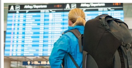
Urlaubsstimmung ade: Welche Ansprüche Urlaubern bei Reisemängeln zustehen und wie sie vorgehen sollten