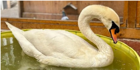
Tierpflegerin rettet Schwan am Mainzer Zollhafen (AZplus)