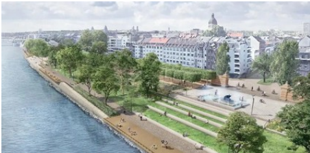
Rheinufer-Sanierung: Mainz bekommt Fördermittel (AZplus)