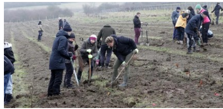
Mainzer Frauenlob-Schüler pflanzen Bäume in Framersheim (AZplus)