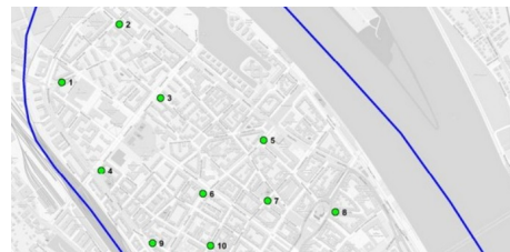
Neuordnung der Parkregelung für E-Tretroller in der Innenstadt tritt ab 01. März 2026 in Kraft