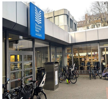
SPD-Forderung: Bücherei nicht leer stehen lassen!