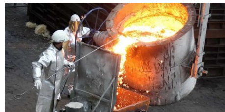
Römheld & Moelle: Neustart nach erfolgreicher Sanierung