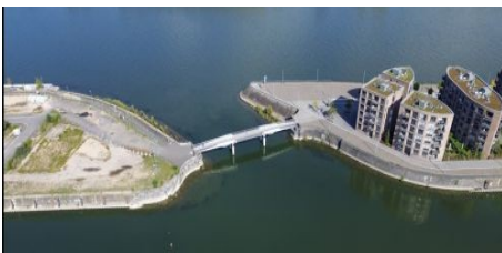
Sperrung der Klappbrücke über der Zollhafen-Einfahrt vom 02.-06. März

Außerdem blicken wir voraus auf die Veranstaltungen der kommenden Woche.