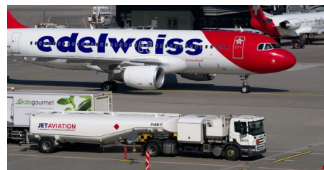
Kerosinmangel und steigende Preise: Was Pauschalreisende jetzt wissen müssen