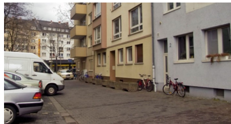
100 neue Bäume für die Neustadt: 68 konkrete Standorte bringen mehr Tempo in die Begrünung