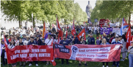
Kämpferische Parolen zum Tag der Arbeit in Mainz (AZplus)

Alle Meldungen finden Sie auch in den Themen des Monats