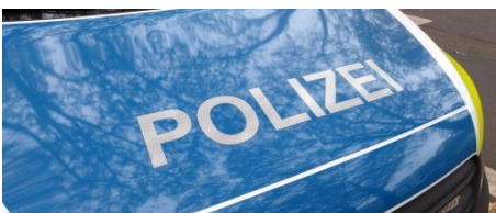
▶ Gedränge beim Bus führt am Hauptbahnhof zu körperlicher Auseinandersetzung ▶ Werkzeuge aus Firmenfahrzeug in der Richard-Wagner-Straße entwendet ▶ Fahrraddiebstahl in der Nackstraße - Tatverdächtiger gestellt