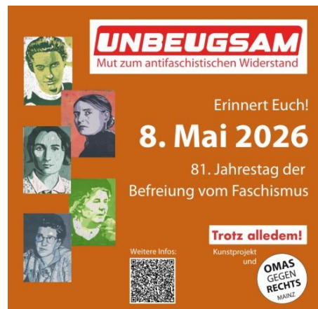
8. Mai – Tag der Befreiung vom Faschismus