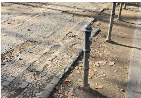
Mosaikpflaster auf Mittelstreifen der Kaiserstraße beschädigt - Verwaltung kündigt weitere Reparaturen für Frühjahr 2027 an

Außerdem blicken wir voraus auf die Veranstaltungen der kommenden Woche.