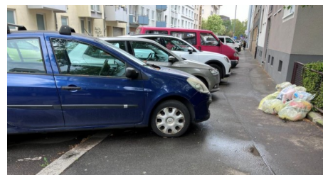
Im Mobilitätsausschuss wurden die Ergebnisse des Fußverkehrschecks für die Mainzer Neustadt präsentiert - Abschlussbericht herunterladen