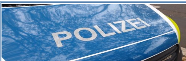
Hattenbergstraße: Zwei Tatverdächtige greifen Supermarktmitarbeiter an und flüchten

Verpackung versus Realität: Was steckt wirklich in Müsli, Nusscreme & Co.? - Frühstücksprodukte im Inhalts-Marktcheck der Verbraucherzentrale Rheinland-Pfalz