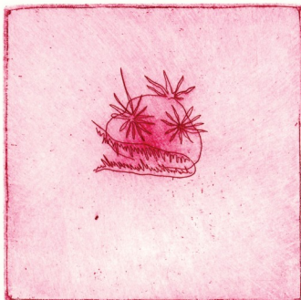
Neue Ausstellung in der EMDE Gallery ab dem 10. Juli

Alle Meldungen finden Sie auch in den Themen des Monats