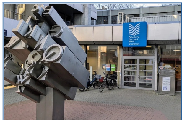
Zwei neue monatliche Führungen in der Öffentlichen Bücherei – Anna Seghers