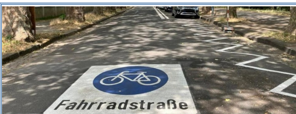
Trotz Kritik an Mainzer Fahrradstraßen: Kein Anlass für eine Neubewertung