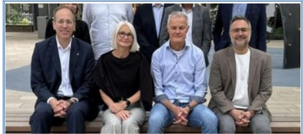
Neuer Schulhof für die Leibniz- und Anne-Frank-Schule fertig (AZplus)