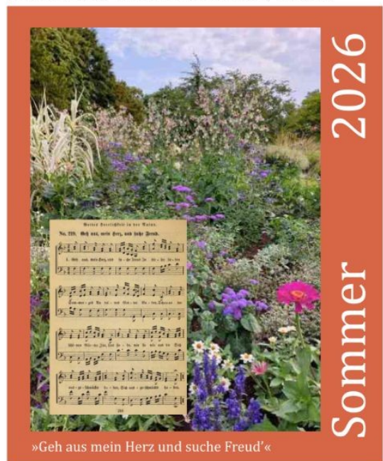
Text: Paul Gerhardt (1607-1676)