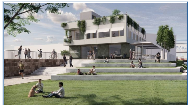
Neue Gastronomie auf der Nordmole - Wo einst der „Schorsch“ die Menschen anlockte, entsteht ein Wohlfühlort mit Blick auf das Grünufer und Ausblick auf den Rhein