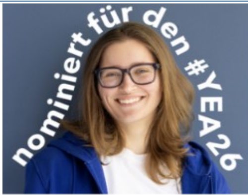
Buchhändlerin aus Mainz für den Young Excellent Award 2026 nominiert