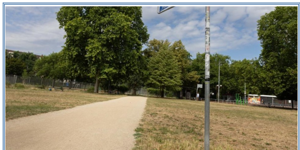
Ortsbeirat streitet über die Beleuchtung auf dem Goetheplatz