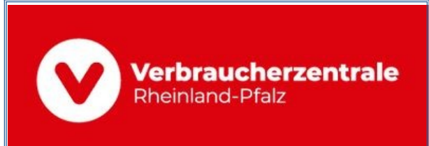
Sommerzeit ist Keimzeit - Gut essen trotz Hitze: sicher, hygienisch und nachhaltig