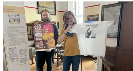
Schwuguntia übergibt Stadthistorischem Museum Mainz Ausstellungsstücke aus über 30 Jahren CSD Mainz