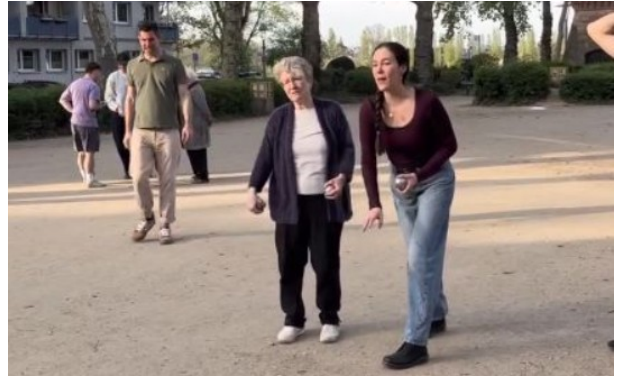
SPD Mainz-Neustadt: Boulespielen auf dem Feldbergplatz - Unebenheiten ausgleichen