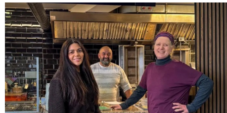
Nach Brand startet Pizzeria Fortuna neu in Mombach (AZplus)