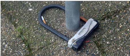
Fahrrad sichern – Diebstahl vorbeugen: Keine Chance für Fahrraddiebe