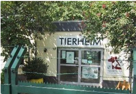
Tierheim Mainz: Umzug in Interimslösung im Zuge des Hochstraßenabbruchs

Außerdem blicken wir voraus auf die Veranstaltungen der kommenden Woche.