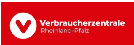
Ab sofort wieder KfW-Zuschüsse für Barrierefreiheit und altersgerechtes Umbauen