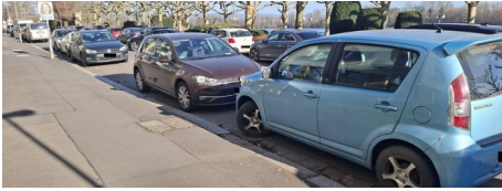
„Parken entgegen der Fahrtrichtung“ nimmt spürbar zu – Stadt will stärker kontrollieren