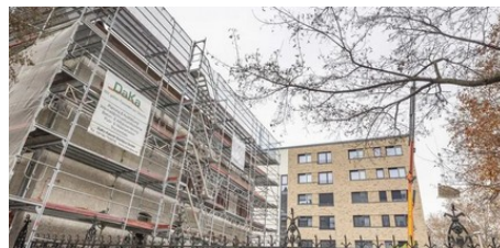
Grünes Licht für die Kulturbäckerei in Mainz