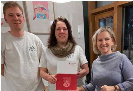
Ein Jahr von „krumm & schepp“ in der Neustadt

Außerdem blicken wir voraus auf die Veranstaltungen der kommenden Woche.