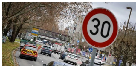
Eklat: Mainzer Stadtrechtsausschuss zu Tempo-30 abgebrochen (AZplus)