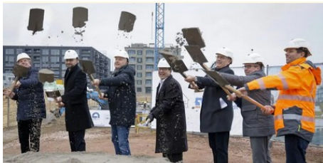
„Rheinwiesen Living“: Bis 2027 sollen am Zollhafen 78 Wohnungen entstehen (AZplus)