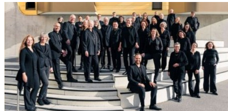
Singfreudige Männer, wo seid ihr? Das Ensemble Vocale Mainz sucht zur Verstärkung der Sänger dringend 2-3 Tenöre