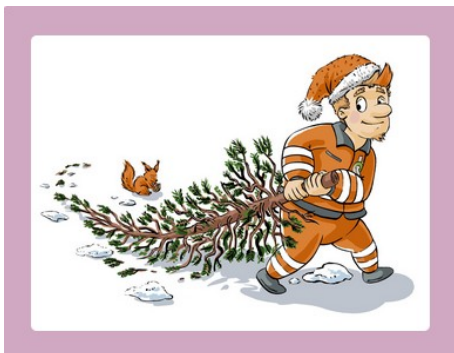
Weihnachtsbaum-Abholung erfolgt am 17. Januar 2026