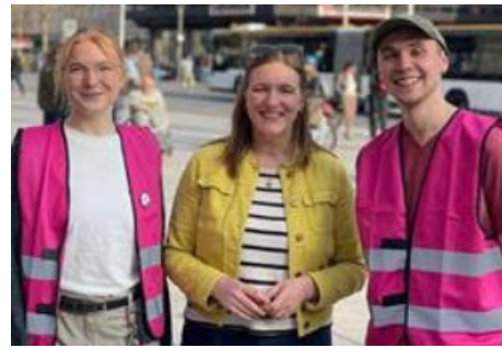
Ministerium sichert Finanzierung der Männer*beratung für das Jahr 2026