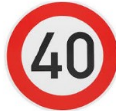
Tempo 40 sorgt in Stadtratsfraktionen für Unverständnis (AZplus)