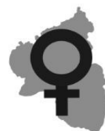
Frauen- und Gleichstellungspolitik zur Landtagswahl 2026: Frauenbündnis befragt Parteien – Antworten jetzt veröffentlicht