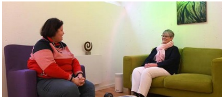
Wenn der Kummer einen erdrückt: So hilft „Trauerwege Mainz“ (AZplus)