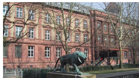
Eltern des Rabanus-Maurus-Gymnasiums schlagen Alarm