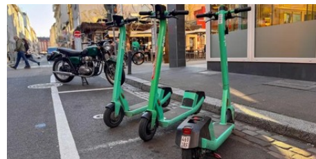
Neue Parkregeln für E-Scooter in Mainz: Klappt das schon?