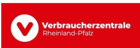
Klare Sicht bei Reinigungsangeboten im Frühjahr: So schützt man sich vor unseriösen Dienstleistern