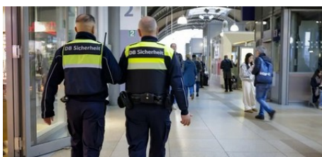
Mainzer Hauptbahnhof: Mehr Sicherheit und Sauberkeit (AZplus)