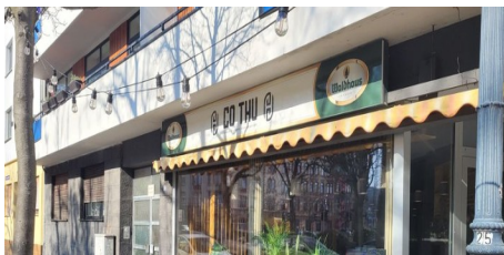
Restaurant mit Sushi-Bar eröffnet am Peter-Cornelius-Platz

Außerdem blicken wir voraus auf die Veranstaltungen der kommenden Woche.