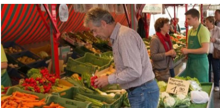
Wochenmarkt in der Mainzer Neustadt wird verlegt