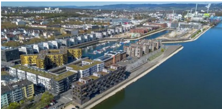
Im Zollhafen schließt sich die Baulücke auf der Nordmole (AZplus)