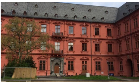
DSD: Erneute Förderung für Sanierungsarbeiten am Kurfürstlichen Schloss Mainz