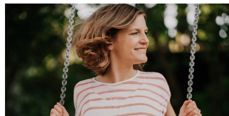
Mainzer Kindermusikerin startet als Polly Raketete durch (AZplus)