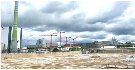
Diskussion um Gaskraftwerk auf Ingelheimer Aue geht weiter (AZplus)