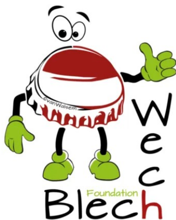
Kronkorken - Gutes für die Umwelt und Gutes für einen sozialen Zweck - Sammeln Sie mit!

Alle Meldungen finden Sie auch in den Themen des Monats