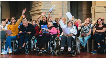
Senior:innen singen ihre „Lebenslieder“: Abschlusskonzert des Martinsstifts Mainz in der Christuskirche