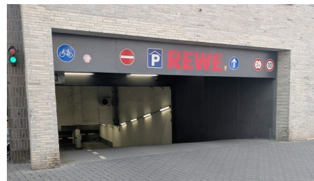
Parkhäuser in der Neustadt nehmen nicht an Angebot Park@Night teil - SPD fordert Gespräche