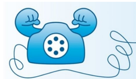
Gesundheitstelefon: Fit für die Schule – Was ist wichtig für den Schuleintritt?