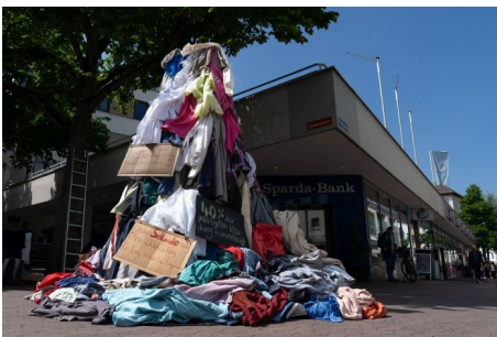
Unser Kleiderkonsum wächst, unsere Erde nicht - Aktionen zum deutschen Erdüberlastungstag

Außerdem blicken wir voraus auf die Veranstaltungen der kommenden Woche.