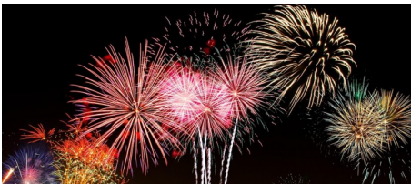
Feuerwerk zur Frühjahrsmesse am Mainzer Rheinufer erneut inmitten der Vogelbrutzeit