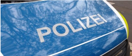
► Kaiserstraße - Konsequenter Kontrolldruck: Polizei nimmt aggressiven Randalierer in Gewahrsam ► Hauptbahnhof Mainz: Haftbefehl vollstreckt, Sicherstellung von Betäubungsmittel, Bundespolizei stellt Mann mit zwei Haftbefehlen und Mann bedroht und beleidigt Polizisten