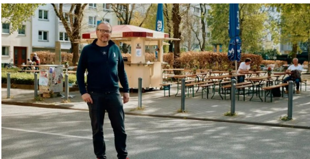
Nach Brand: Mainzer „Krokodil“ eröffnet Biergarten (AZplus)