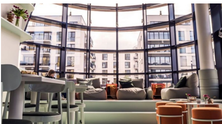
Auszeichnung für Mainzer Bistro Goldmarie und Hotel Brunfels (AZplus)