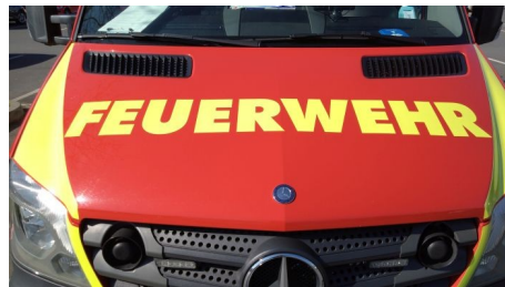
Brandeinsatz nach Notruf über "nora"-App - oder: "Der Hirtenjunge und der Wolf" als Feuerwehr Mainz Version

Alle Meldungen finden Sie auch in den Themen des Monats