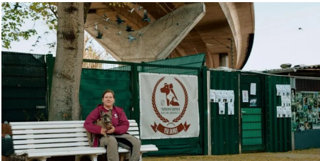
Mainzer Tierheim muss umziehen: Was bisher feststeht (AZplus)