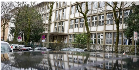
Sophie-Scholl-Schule bald in früherem Hochschulgebäude? (AZplus)