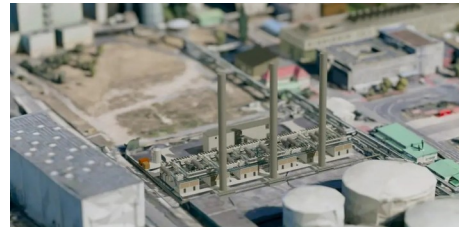
Neues Gaskraftwerk in Mainz: Umweltschützer äußern Bedenken (AZplus)