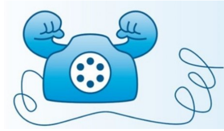
Gesundheitstelefon: Der kleine Snack zwischendurch – so gelingt gesunde Ernährung am Arbeitsplatz