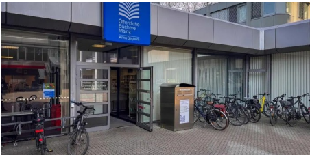
Was passiert mit Räumen der Anna-Seghers-Bücherei? (AZplus)

Außerdem blicken wir voraus auf die Veranstaltungen der kommenden Woche.