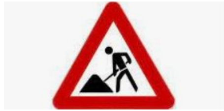
Im Zuge von Leitungsverlegearbeiten für eine Stromtrasse musste die Obere Austraße voll gesperrt werden