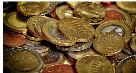
Fokuswoche Geld 2026: Kostenfreie Online-Vorträge der Verbraucherzentralen

Sie haben sich einen neuen Laptop gekauft, weil das alte Gerät nicht mehr auf dem neuesten Stand war?