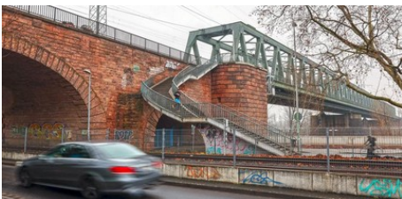
Kosten für Kaiserbrücke in Mainz deutlich gestiegen (AZplus)

Außerdem blicken wir voraus auf die Veranstaltungen der kommenden Woche.