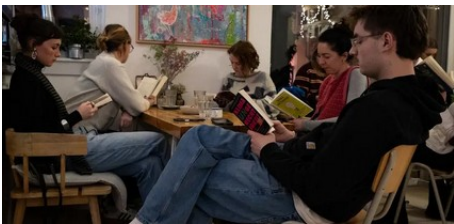
Neuer Trend: Lesefeten in Mainz ziehen junges Publikum an (AZplus)