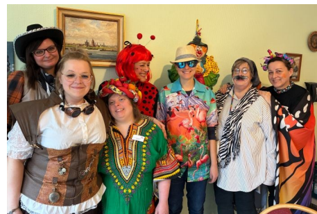
Dreifach donnerndes Helau in der Tagespflege „Einklang“ im Martinsstift Mainz