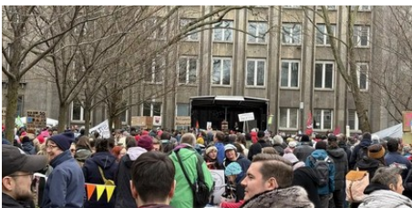
„Aktionstag gegen rechte Tendenzen“: Drei Demos in Mainz

Außerdem blicken wir voraus auf die Veranstaltungen der kommenden Woche.