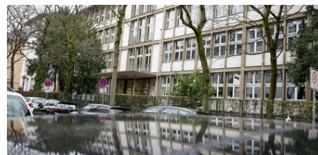
Umzug der Sophie-Scholl-Schule könnte schnell gehen (AZplus)