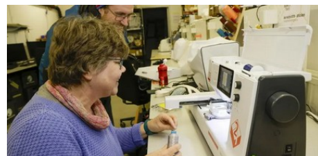
Gemeinsam kreativ sein in der Offenen Werkstatt in der Boppstraße (AZplus)