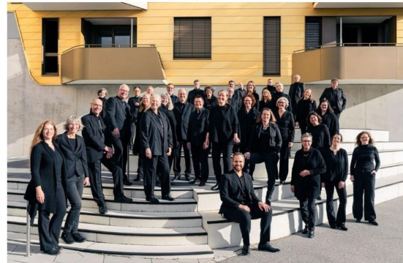
Consolation – Trost

.....so lautet der Titel der Soiree des Ensemble Vocale Mainz. Es erklingen Werke u. a. von Giovanni Palestrina (1525-1594), Johann S. Bach (1685-1750), Max Reger (1873-1916), Maurice Duruflé (1902-1986), Pierre Villette (1926-1998), Christopher Tin (1976*).