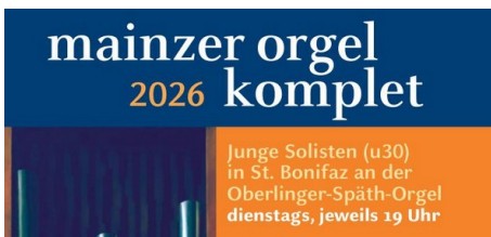
mainzer orgel komplet 2026: Konzertreihe mit noch jungen, ausgezeichneten internationalen Solisten