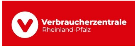
Soja im Faktencheck: Mythen, Risiken und Chancen

Alle Meldungen finden Sie auch in den Themen des Monats