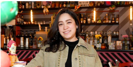
Mexikanisches Restaurant plant Umzug in die Neustadt (AZplus)