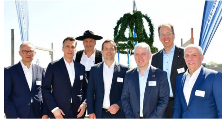
Richtfest für Marina B - LBBW Immobilien setzt weiteren Meilenstein im Zollhafen