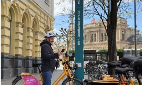
Mobilstationen kombinieren Bus und Fahrrad