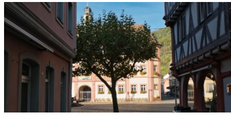
BUND: Mehr Grün in die Städte - „Baum-Woche“ mit Umfrage und Mitmachangeboten zum Tag des Baums