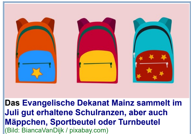
Das Evangelische Dekanat Mainz sammelt im Juli gut erhaltene Schulranzen, aber auch Mäppchen, Sportbeutel oder Turnbeutel