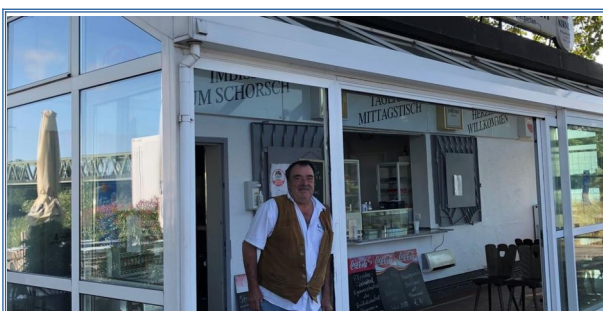
Nachfolger für Mainzer Kult-Kiosk „Schorsch“ gefunden