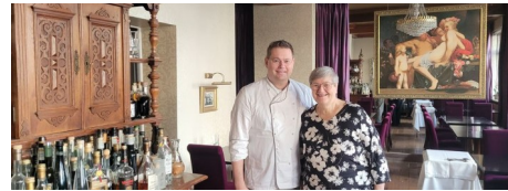
„Geberts Weinstuben“: Deshalb schließt das Mainzer Lokal