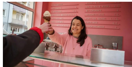
Mainzer Eiscafé starten mit neuen Kreationen in die Saison (AZplus)

Postkarten-Aktion des Frauen*notrufs Mainz sensibilisiert für Gefahren durch K.O.-Tropfen