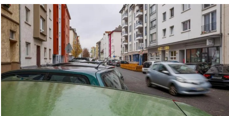
Kreuzung Wallaustraße/Josefsstraße soll grüner werden (AZplus)