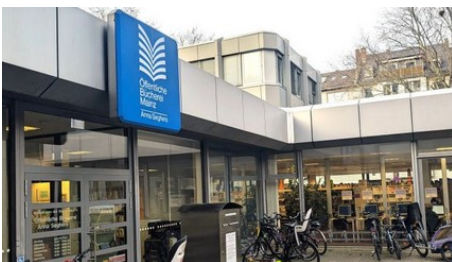
Aufforderung des Ortsbeirats an Stadt: Umfeld der Bonifaziustürme nicht verkommen lassen!