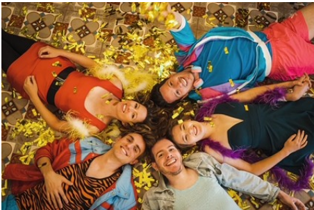
"Die Affirmative" lädt ein zum internationalen Improtheaterfestival

Außerdem blicken wir voraus auf die Veranstaltungen der kommenden Woche.